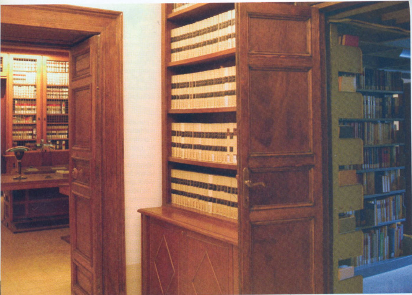
Sopra: la biblioteca dell'Istituto, che vanta un patrimonio di quasi 100 000 volumi. A fianco: la sala conferenze.

provenienza. Parallelamente sta arrivando rapidamente a conclusione un'altra impresa monumentale, iniziata più di venti anni fa: la pubblicazione di un repertorio di tutte le fonti narrative disponibili per lo studio del Medioevo. E non solo italiano. Il Repertorium fontium , iniziato più di venti anni or sono, infatti, coinvolge studiosi italiani e stranieri che concorrono alla compilazione di questo enciclopedico inventario dei testi i cui manoscritti, per le vicissitudini della storia, sono oggi disseminati nelle biblioteche di tutto il mondo.