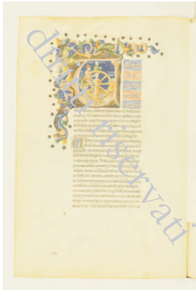
Fig. 3 – Biblioteca Apostolica Vaticana, Vat. lat. 7320, f. 145v