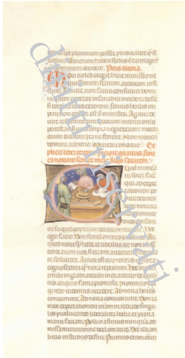
Fig. 2 – Biblioteca Apostolica Vaticana, Ross. 604, f. 21r