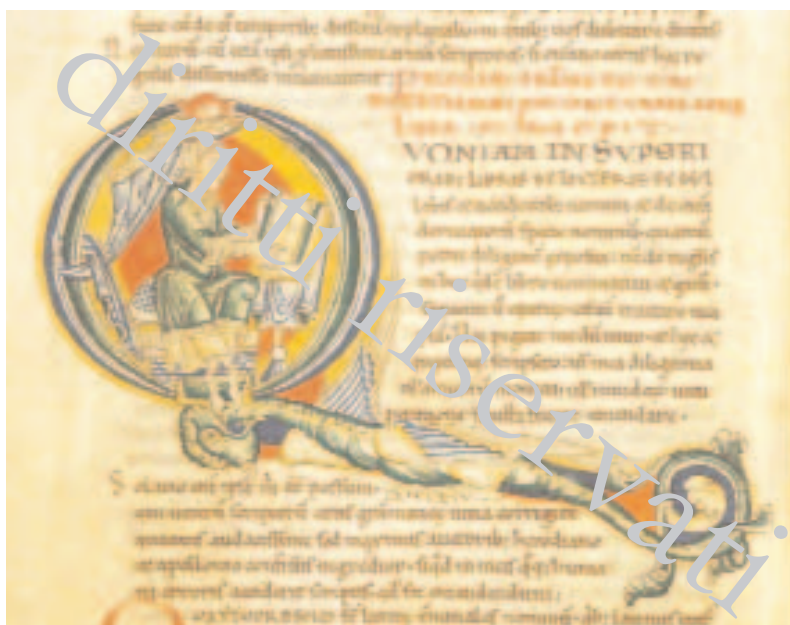
Fig. 21 – Biblioteca Apostolica Vaticana, Ross. 500, f. 44v