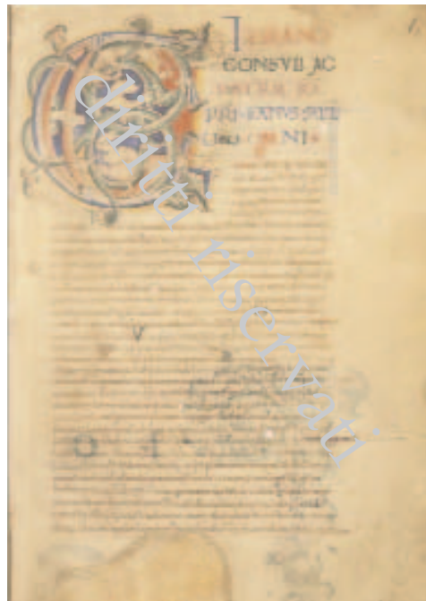
Fig. 25 – Biblioteca Apostolica Vaticana, Ross. 500, f. 1r