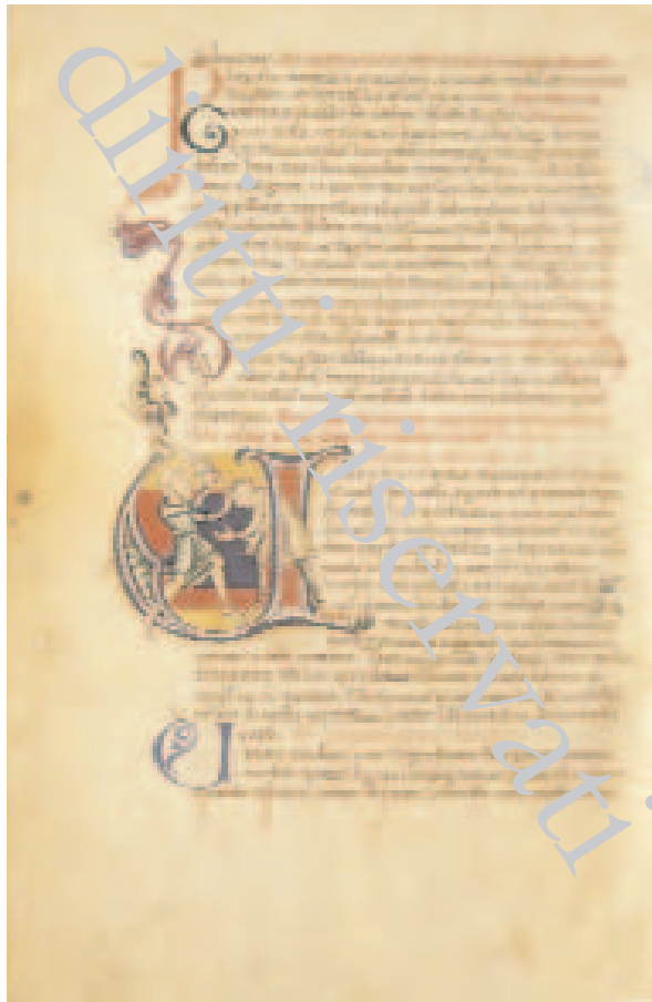
Fig. 22 – Biblioteca Apostolica Vaticana, Ross. 500, f. 78v