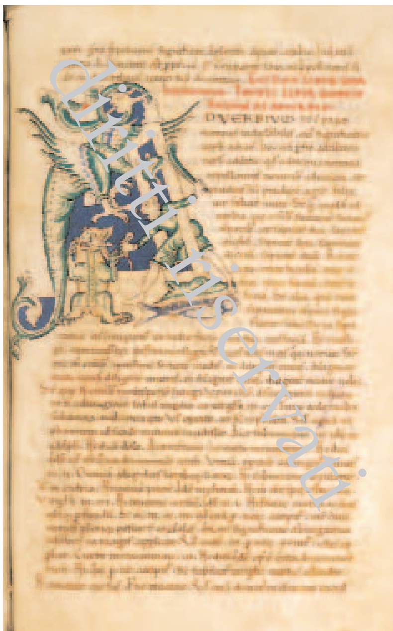
Fig. 23 – Biblioteca Apostolica Vaticana, Ross. 500, f. 148r